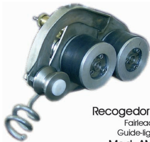
Recogedor de Tira Fairlead Guide-ligne Mod. AMJ-6

SOLUCIONES A MEDIDA SOLUTIONS SUR MESURE CUSTOM-MADE SOLUTIONS