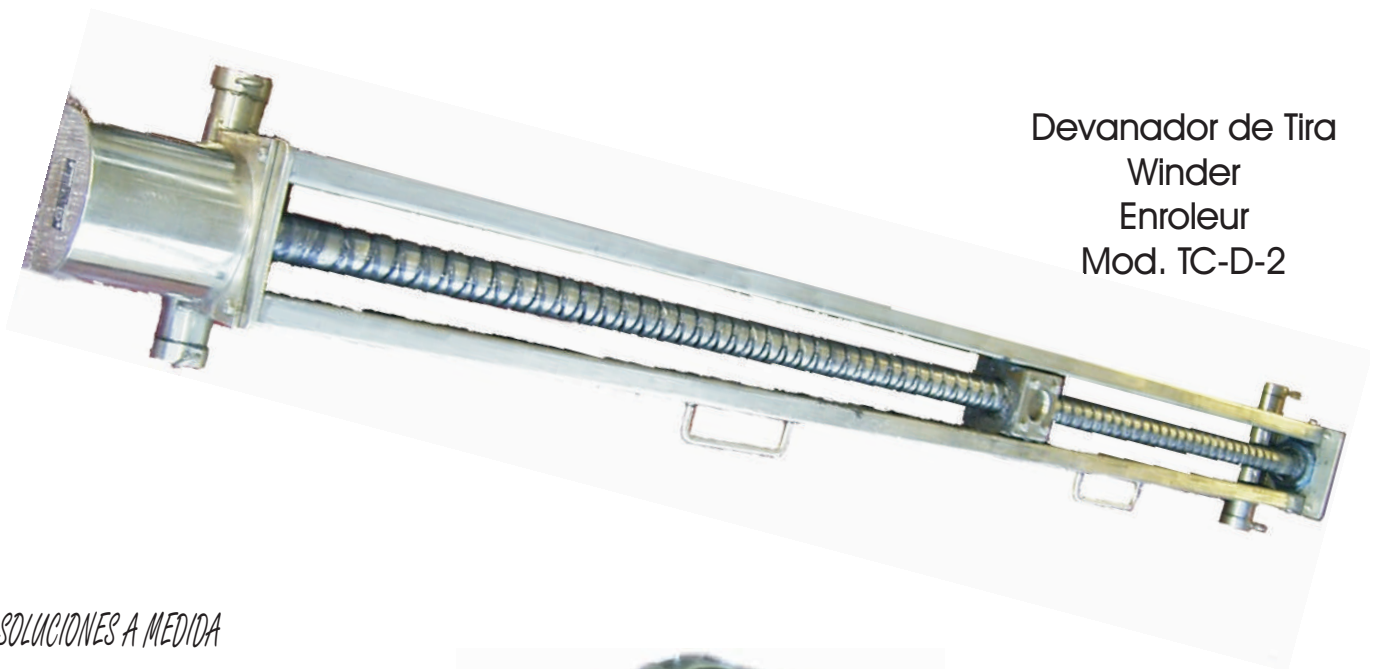
Devanador de Tira Winder Enroleur Mod. TC-D-2

Winder Enroleur Spulmaschine Bobinadeira